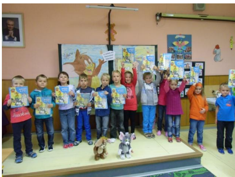
První školní den

Školní rok 2014/2015 byl zahájen rovněž 1.září (za přítomnosti Českého rozhlasu-Region) s počtem žáků 39 v ZŠ a 33 v MŠ. Děti navštěvující školní družinu přišly po prázdninách do zrekonstruovaných místností. Tato oprava a vybavení v hodnotě 90 tisíc je dalším krokem ve zlepšování školních prostor. Dvanáct nových prvňáčků dostalo za přítomnosti starosty Městyse Božejov nové učebnice a drobné dárky.