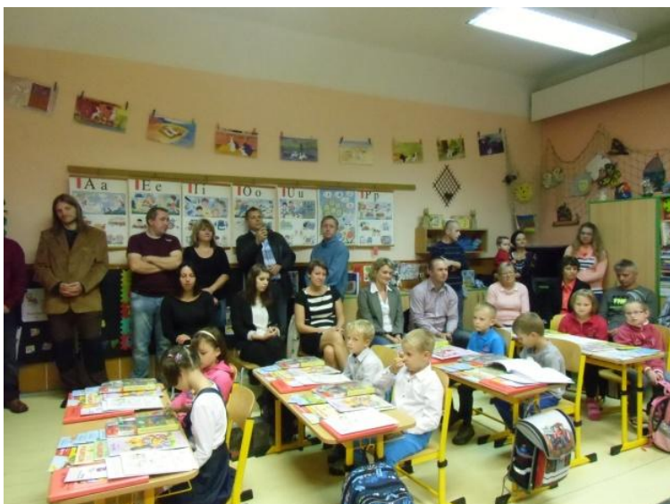
První školní den

Poznámka: Každoroční „Létání s draky“ plánujeme na 10. 10. 2014.