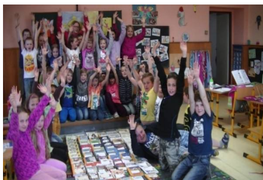
3. místo v národní soutěži KMČ Albatros