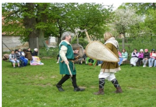
Doba Karla IV.