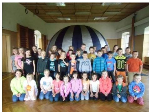
Den dětí – sférické kino 3D