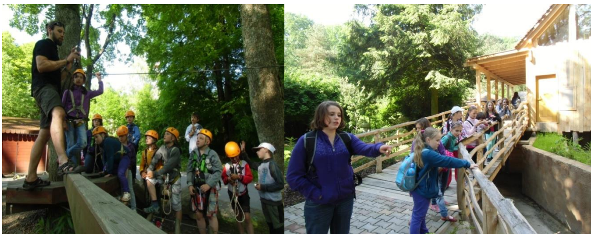
Na výletě v Lanovém centru Křemešník a v ZOO Jihlava